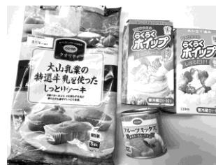
↑ 今回使用した商品