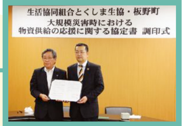
生活協同組合とくしま生協・板野町 大規模災害時における 物資供給の応援に関する協定書 調印式