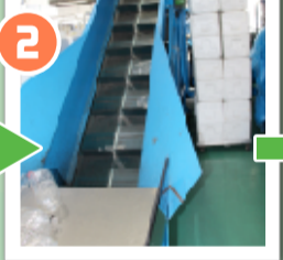
ペットボトルプレス機