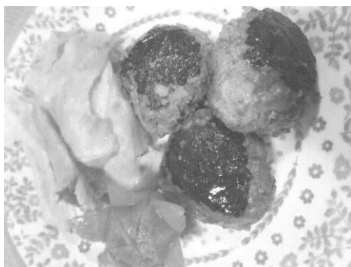
【徳島南支所 組合員さんより】