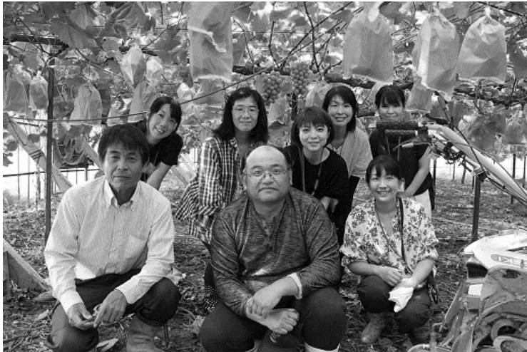
【原田農園さんと食育委員会メンバー】

を受けて、阿波市にある原田農園さんに店舗(農産部門)職員と食育委員会のメンバーでおじゃました。