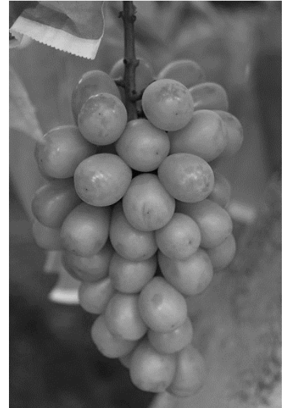
【シャインマスカット】