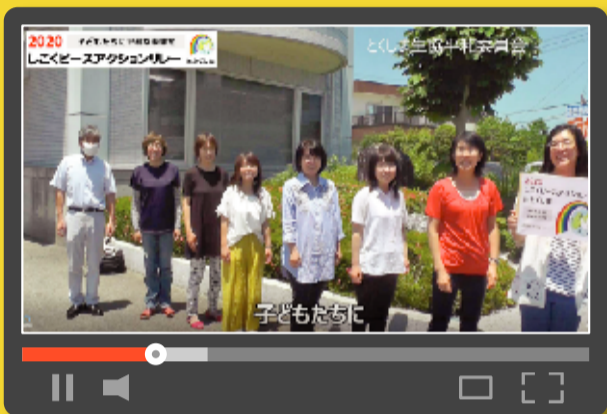
【▲とくしま生協本部前にて】 とくしま生協本部前には「被爆アオギリ2世」が植えられています。