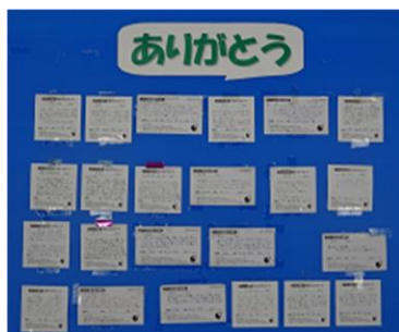
【ありがとうカード】

高性能ドライブレコーダーを導入し、より高い安心安全な運転品質をめざし運用を始めました。特に録画機能の活用ではメンバー全員での危険事例の情報共有、あおり運転の抑制等（被害の軽減についても）、防衛運転の観点からも効果を高められるように進めました。