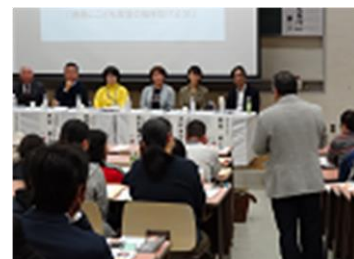
【こども食堂全国ツアー in 徳島】