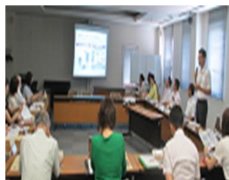
【エシカル消費学習会】