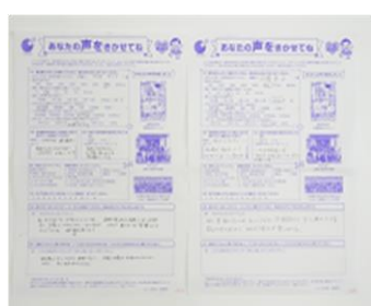
【あなたの声をきかせてね】