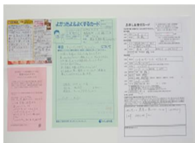
【問い合わせカード各種】

みなさまの日々の暮らしに関する想いや願い、とくしま生協へのご意見ご要望について1,862件アンケートが寄せられました。みなさまから寄せられた声については理事会で共有・交流、話し合いながら、次年度以降の方針づくりに反映できるよう取り組みました。