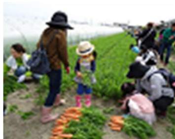
【親子にんじん収穫体験】