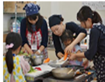
【にんじんを使った親子料理教室】