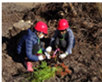
【とくしま協働の森づくり事業】