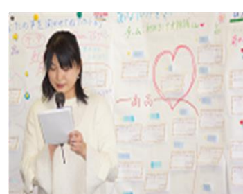
【理事会での共有・交流】