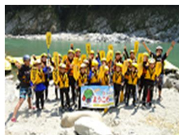
【福島の子ども保養プロジェクト】