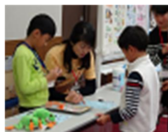
【食育フェスティバル】