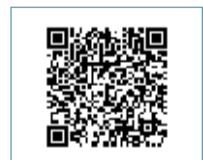
↑スマホの方はこちらをスキャン