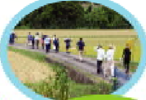
開会式が終わわり、いよいよ稲刈り体験です。最初に田植えをした場所に戻って移動しました。