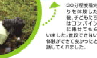
30分程度稲刈り体験した後、子どもたちはコンバインに乗せてもらいました。普段できない体験ができて良かったと感じてくれました。

集合場所である美波町の赤松神社で開会式が開催され、赤松地区が米づくりに誇りをしている場所である事や今年の乙姫米の出産率などのお話がありました。食糧自給率が38%となっている中で、とくしま生協だけが販売している乙姫米をもっとと組合員の皆さんに食べていただきたいとの生産者の思いも伝えられました。