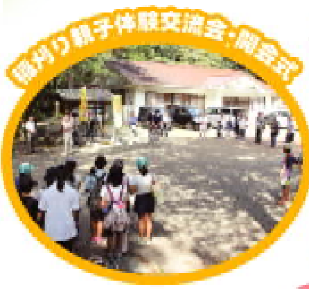
稲刈り親子体験交流会・開会式