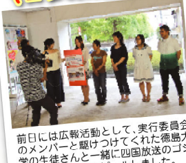
前日には広報活動として、実行委員会のメンバーと観つけてくれた徳島大学の生徒さんと一緒に四国放送のゴジカルに出演してアピールしました。