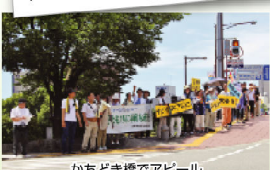
かちどき橋でアピール

行進となりました。か ちどき橋の両側から行 き来する車や通行され る方にアピールを行 いました。トラックから クラクションで応援し てくれたり通行者が声 をかけてくれたりと良 いアピール行進ができたという参加者の感想もありま した。閉会式では、徳島県から次の開催地である香川県の代 表者に横断幕が引き継がれました。 ピースアクションリレーは、毎年四国4県で平和の思い をリレーしていき、最終の広島県までつないでいく取り組 みです。「子どもたちに平和な未来を」と書かれた横断幕を 掲げ、各県で平和に関わる活動を行っています。今年は