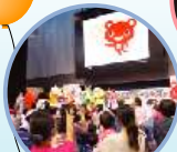
▲ゆるキャラじゃんけん大会