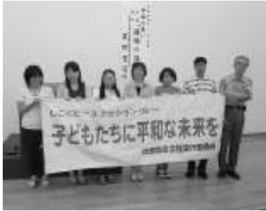
▲広島因島で引き継ぎ