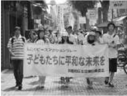
▲徳島市内をアピール