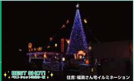
BEST SHOT! ベストショット撮影一役