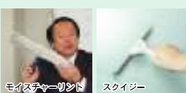
モイスターワイパー スクイジー これらを使えばキレイに仕上がります。ホームセンターでも販売しています。