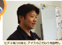
ピロピロのあと、アイスのごたごたを説明していただきました。