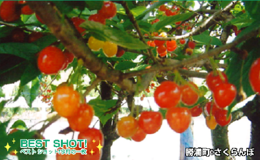
勝浦町のさくらんぼ