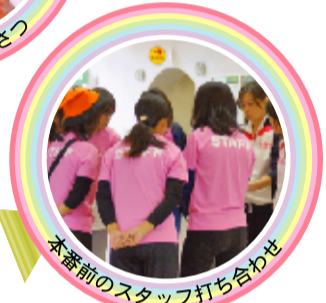
本番前のスタッフ打ち合わせ