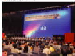
●ヒロシマ平和記念ミュージアム