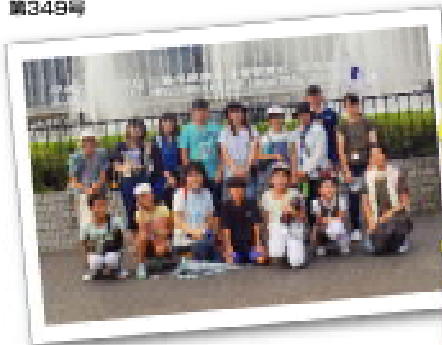
●ヒロシマ平和記念ミュージアム