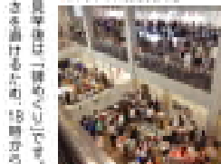
●参加の感想文(抜粋)

8/5(土) 日本橋の日本橋青年会議所のホールにて開催された「ヒロシマ平和の旅」のイベントに参加させていただきました。会場には多くの参加者が集まり、平和の重要性について学びました。また、展示物や資料を通して、戦争の悲惨さや平和の大切さを実感することができました。この体験を通じて、平和を大切にし、未来を明るくしていきたいと考えています。