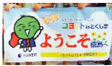
徳島を好きになってもらい、また来てほしいとの思いもあり、横断幕には徳島県のゆるキャラ「すだちくん」が付けられました。