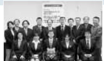
5名のうち3名が新卒(男1人・女2人)、2名が正規登用(男2人)