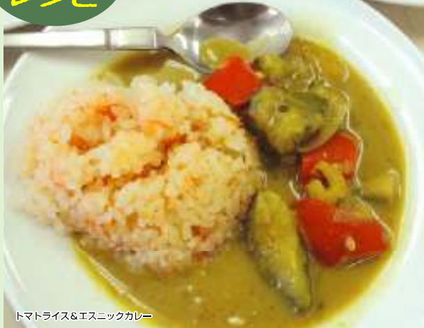
トマトライス&エスニックカレー