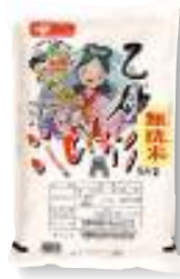
無洗米特別栽培米JA かいふこしひかり 5kg

昼食は、地元の幸を楽しく飲んで欲しいと、新鮮な魚介類や果物をJAかいふさんが用意してくれました。それらの材料を使って、「オリジナル南阿波丼」をいただきました。お腹がいっぱいになったところで次の目的地へ。