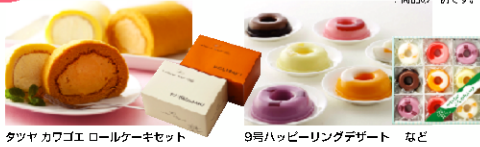
タツヤ カワゴエ ロールケーキセット 9号ハッピーリングデザート など