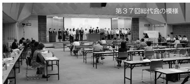
第37回総代会の様様

総代会は決算や剰余金(欠損金)の処分などの承認に加えて、生協を利用して思っていること、要望などを今年度のすすめ方(事業計画)に反映させていくことが主な目的です。