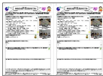
【あなたの声をきかせてね】