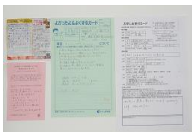
【問い合わせカード各種】

みなさまの日々の暮らしに関する想いや願い、とくしま生協へのご意見ご要望等については、1,295件のアンケートが寄せられました。みなさまから寄せられた声については理事会で共有・交流、話し合いながら、次年度以降の方針づくりに反映できるよう取り組みました。