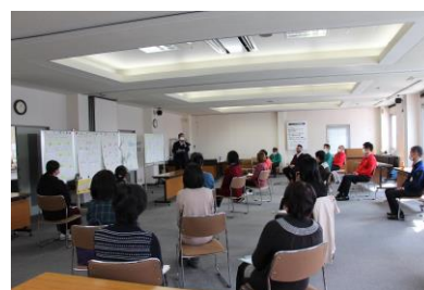
【理事会での共有・交流】