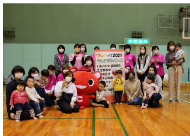
【げんきっず運動会ごっこ】

田植え・稲刈り交流会が中止（新型コロナウイルス感染症の影響）になったことを受け、とくしま生協でしか購入できない特別栽培米こしひかり「乙姫米」の学習会を行い、SNSで発信しました。新米をおすすめする時期には、美波町から「乙姫大使」に来店いただき、店頭で「乙姫米」をアピールしました。