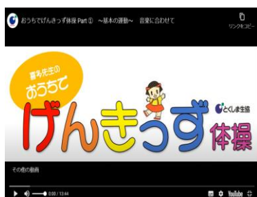
【おうちでげんきっず体操】