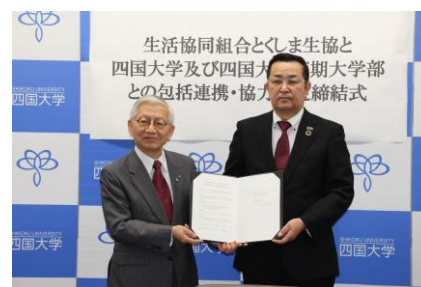
【四国大学との包括連携協定】