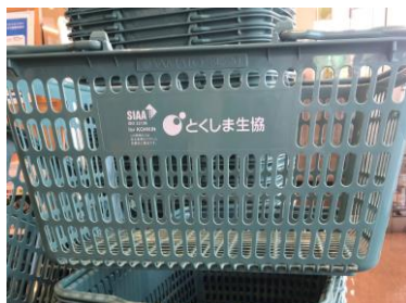
【抗菌型買い物かご】