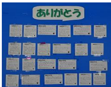
【ありがとうカード】

ドライブレコーダーを活用して危険通知・違反通知を共有することで、昨年より安全運転への意識の向上することができました。引き続きメンバー全員での危険事例を共有し、事故・違反、危険運転ゼロをめざしていきます。