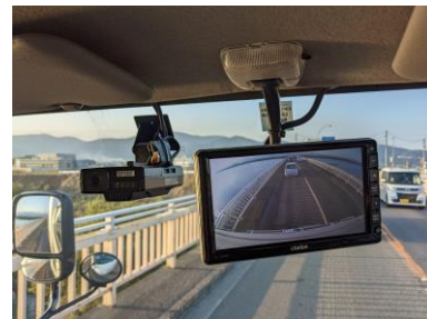
【ドライブレコーダー】