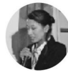
阿南支所 兼友担当